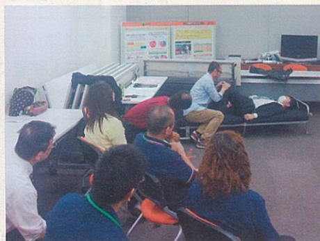
↑ベッドの上でのリハビリ術

4月の樹楽加盟店研修会では、リハビリテーション研究所の講師をお招きして、 通所介護施設での生活リハビリ について実技を交えての研修会を行いました。 福祉・介護職の目線からのリハビリ、即日より実践出来るリハビリ等、改めて学べる部分が多く好評でした。