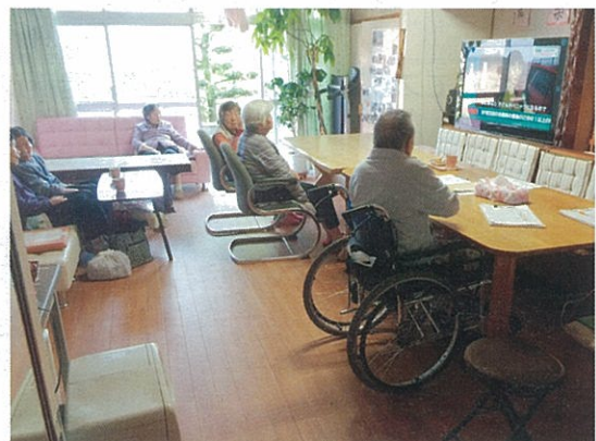
皆様で地震速報を警戒する日々が続きました。

※白石は4月16日、にしぼるは4月24日にライフラインは復旧しました。現在、施設の運営は再開しております。多くの樹楽チェーンからの、ご心配の声・はげましの声援・ご支援をいただきまして本当にありがとうございました。