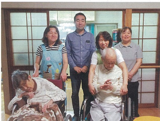
避難先の社宅にて利用者様とスタッフ無事です。