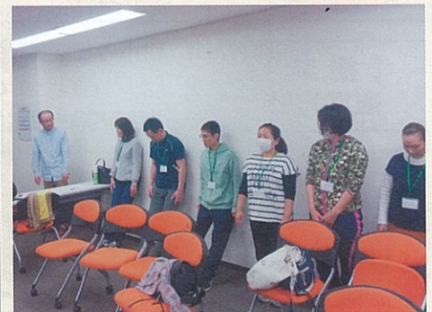
↑施設の壁で手軽に行えるリハビリ術