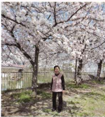
ソーシャルディスタンスを 保ち桜の下で、記念撮影。