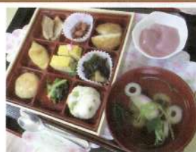
お花見弁当とおやつ♪