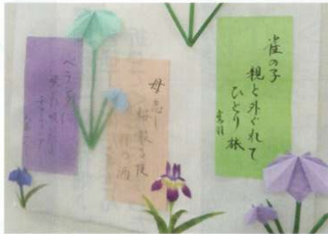
ご利用者様の俳句