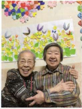
仲良しツーショット