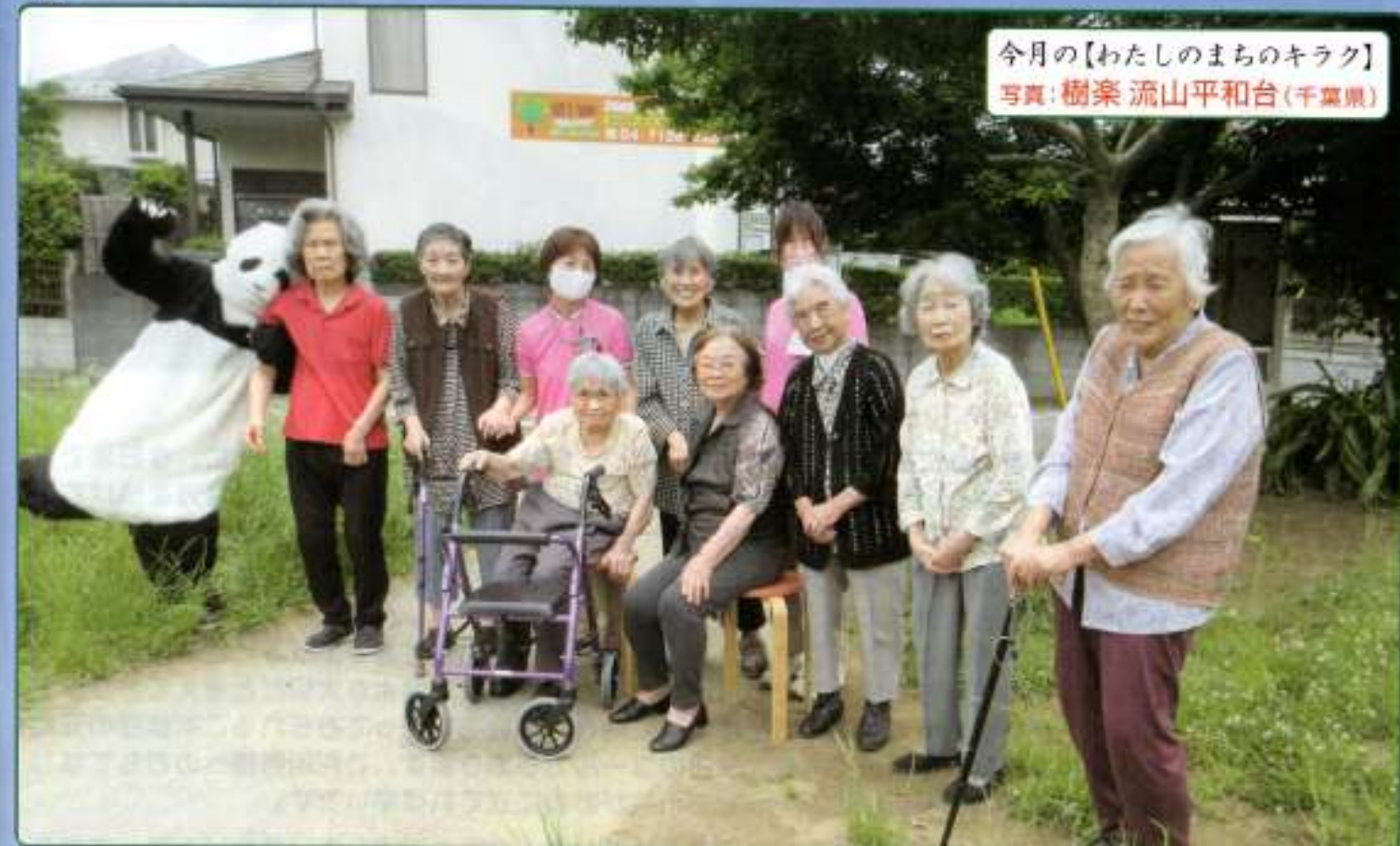
今月の【わたしのまちのキラク】 写真：樹楽 流山平和台（千葉県）