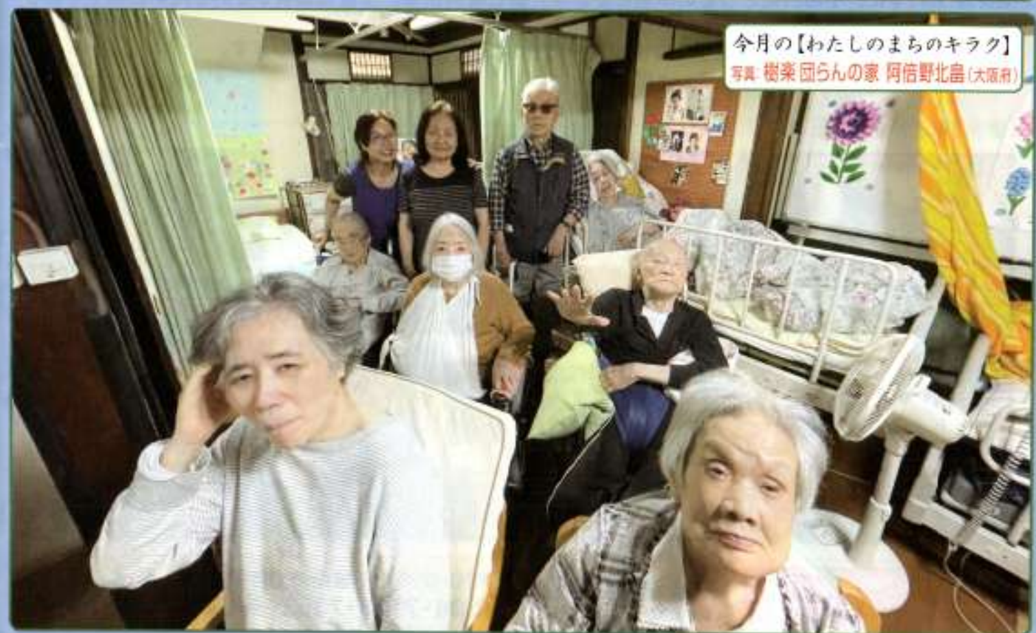
今月の【わたしのまちのキラク】 写真：樹楽 団らんの家 阿倍野北畠（大阪府）