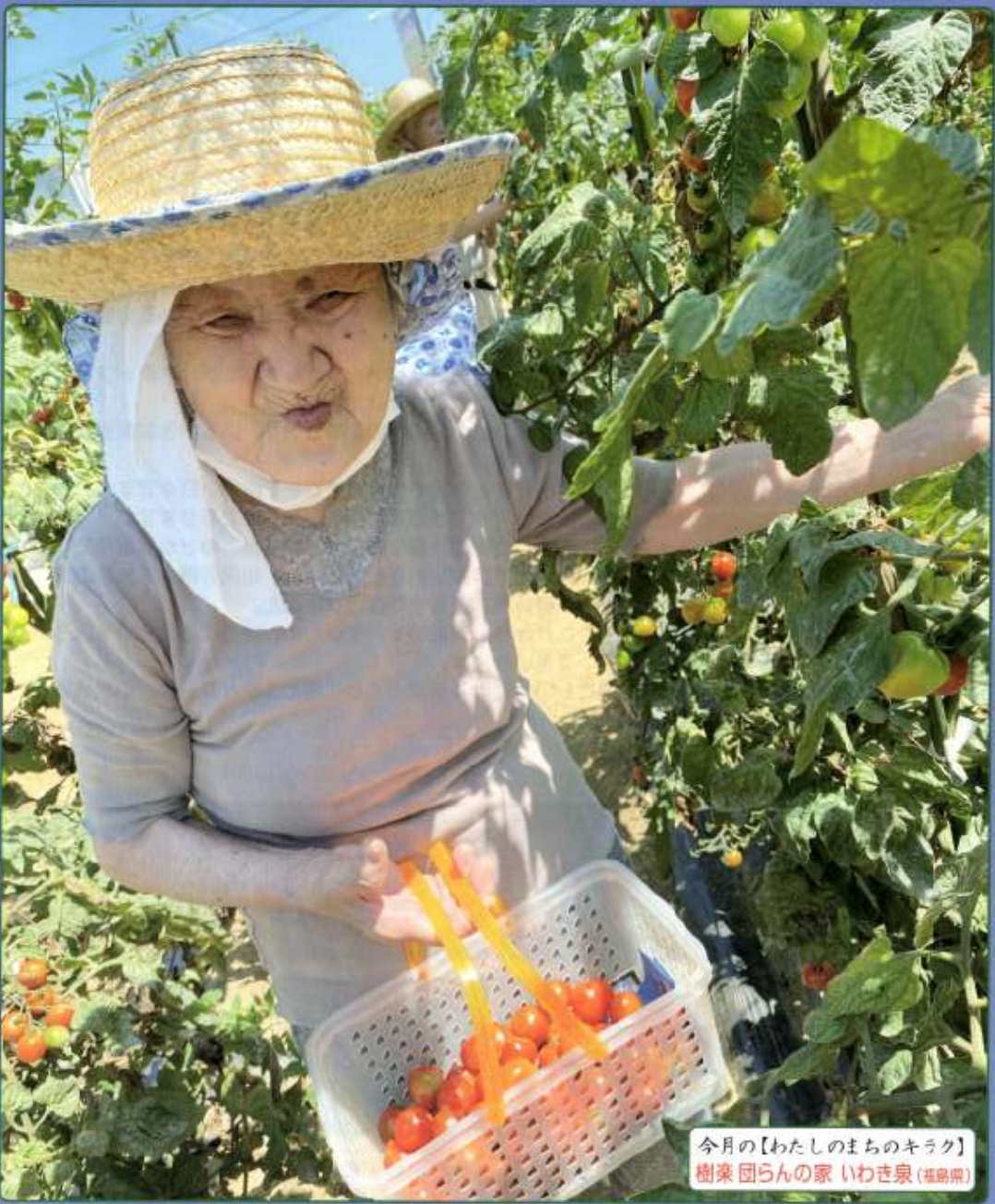
今月の【わたしのまちのキラク】 樹楽 団らんの家 いわき泉 (福島県)