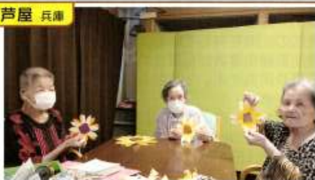
ひまわり、たくさん咲かせます☆彡