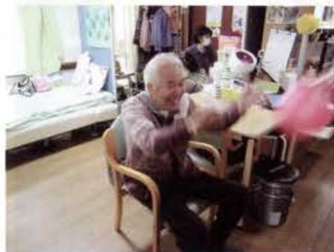
「えいっ！！」ボール投げ。