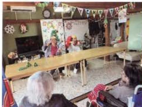
二人羽織で化粧してます。 皆様、爆笑