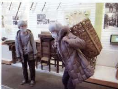
「よっこらせ！」籠背負い。