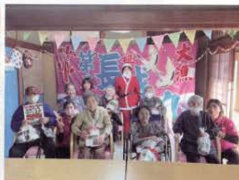
皆様に大変楽しんで頂きました。