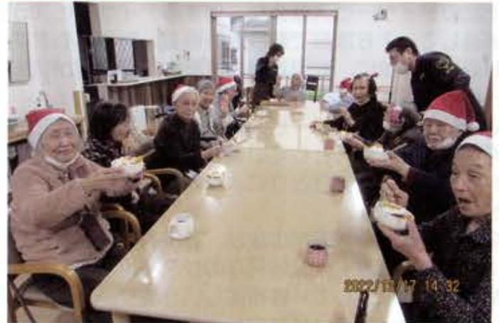
クリスマス会で甘いおやつおいしい