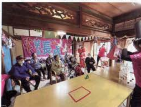
職員による手品に 皆でパワーを送っています(笑)